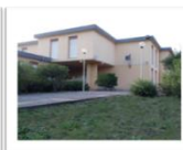
Plesso via Veronese