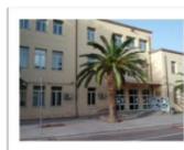
Plesso via Nanni

Con la presente brochure ci si è proposti di rendere consapevoli le famiglie dei nostri futuri alunni, seppur sinteticamente, dell'offerta formativa, rendendosi comunque sempre disponibili a confrontarsi con esse per l'eventuale sperimentazione di diversi modelli orari, sulla base di una seria riflessione e impostazione, valutazione delle opportunità e prospettive.